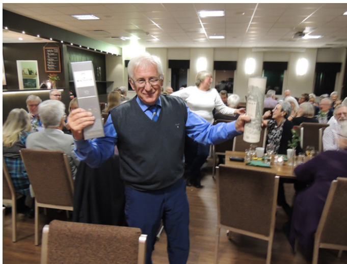
Vinnare 2 som vann 2 vinster.