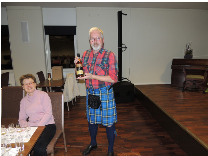
Vinnare av "entre'whisky" Longmorn 20 år