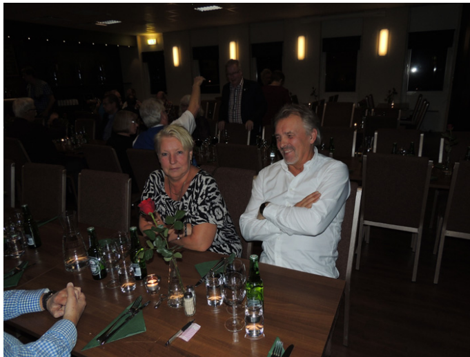
I väntan på maten