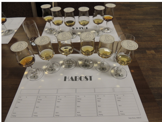
Kvällens glas med små lock